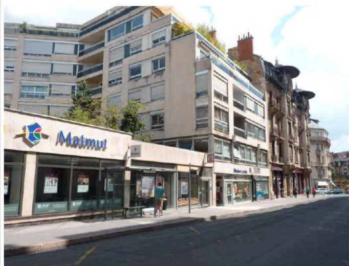
Photographie des extérieurs – Parking existant à proximité de l'agence. L'agence se situe au centre de la photo, entre la « Matmut » et la « Mission Locale ».

Le projet se situe dans un contexte de centre-ville et n'a pas de place de stationnement attribué.