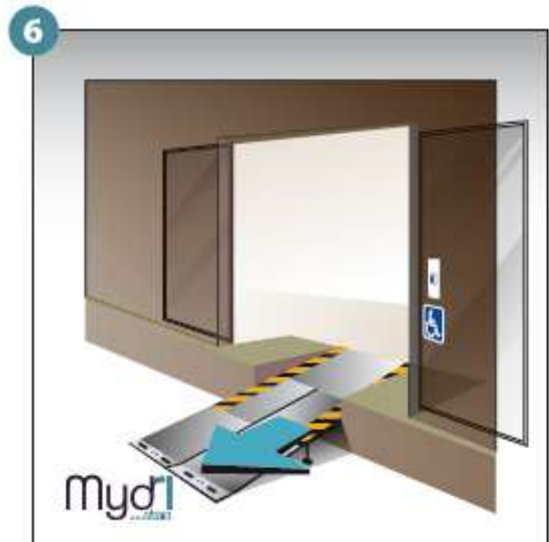
6 - Répéter les opérations pour le deuxième volet