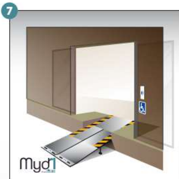
7- Rampe en service