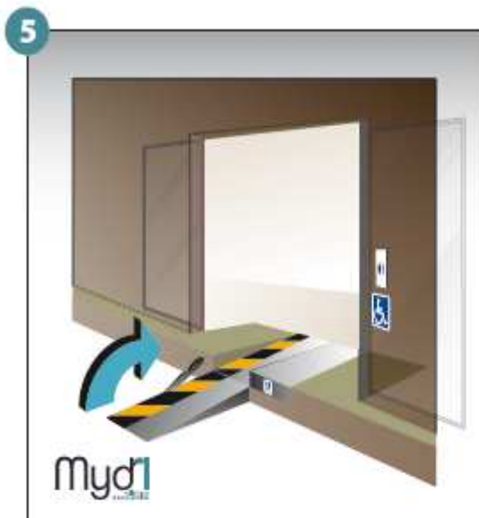
5 - Basculer la poignée qui fera office de chasse roues.