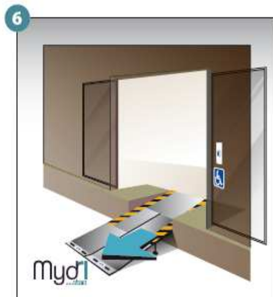
6 - Répéter les opérations pour le deuxième volet