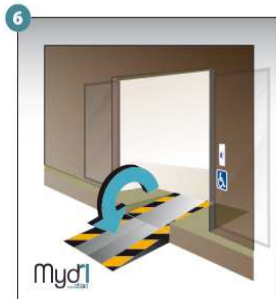
6 - Répéter les opérations pour la deuxième rampe.