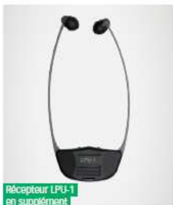
Récepteur LPU-1 en supplément