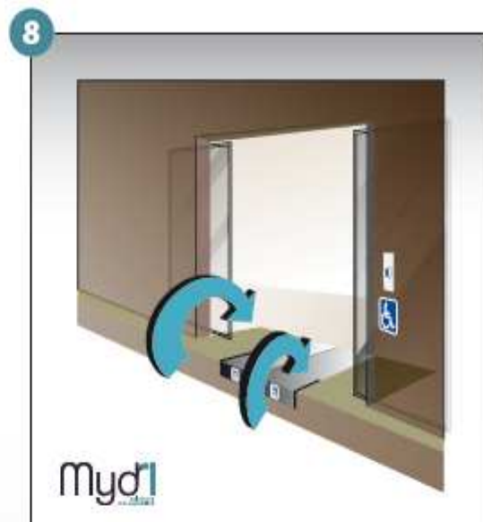
8 - Répéter les manoeuvres précédentes en sens inverse pour fermer la rampe.