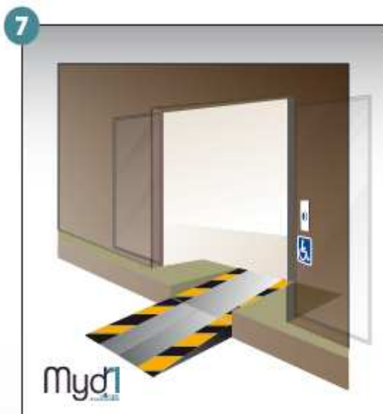
7- Rampe en service.